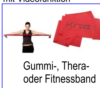
Gummi-, Thera- oder Fitnessband